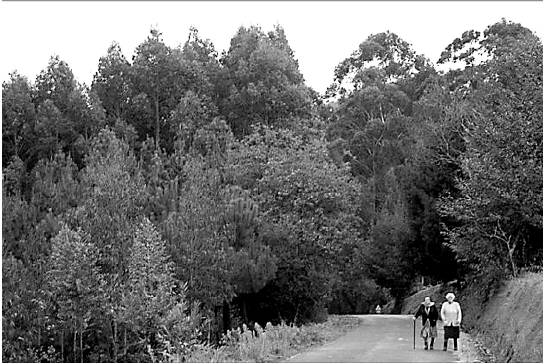
Dos ancianas pasean por los alrededores del Parque Natural de As Fragas do Eume.

El 80% del municipio de Monfero pertenece al Parque Natural de As Fragas do Eume, así que son varias las entidades y particulares que han solicitado las ayudas de Medio Ambiente. A comienzos del pasado mes de junio el anterior departamento autonómico consideraba que todavía no se podía hablar de retraso en el proceso de adjudicación de las subvenciones, ya que el plazo finalizaba el día 30.